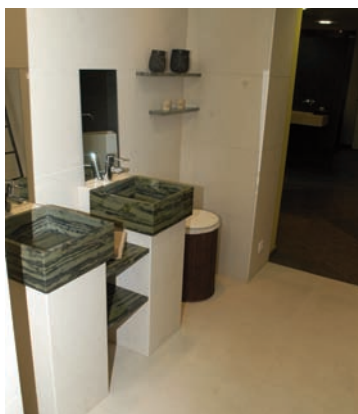
Vues du showroom de la marbrerie Le Gal, qui met en scène des sols et des aménagements de cuisine et de salles de bains, dans des matériaux très décoratifs.